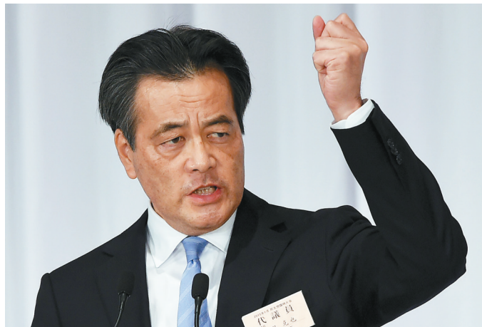
一月十八日,日本民主党党首候选人冈田克也在东京发表演讲。