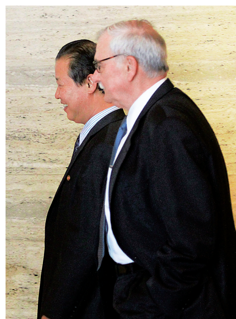
1月18日,在新加坡,参与朝美非正式会议的一名美方代表(前)与一名朝方代表在午餐时间走出酒店电梯间。

新华社新加坡1月18日电(记者马玉洁 陈济朋)美国政府前官员和朝鲜六方会谈代表18日开始在新加坡举行为期两天的非正式闭门会谈。