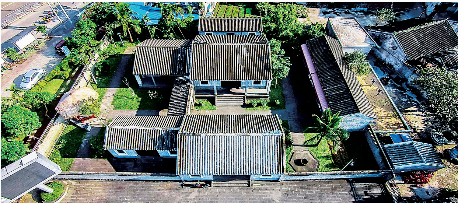
海瑞故居还有一个别名“清正园”,这里还是海南省一个重要的廉政教育基地。