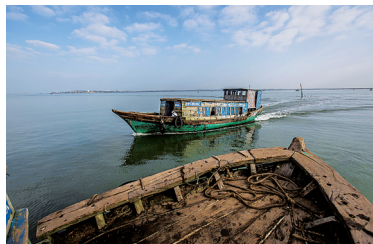
与另外一艘摆渡船擦肩而过。