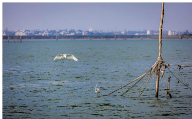
航道上经常看到鹭鸟飞翔。