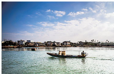
在铺前水域作业的渔船。