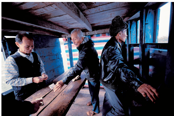
“海上公交”分工明确——一人开船,一人收费。