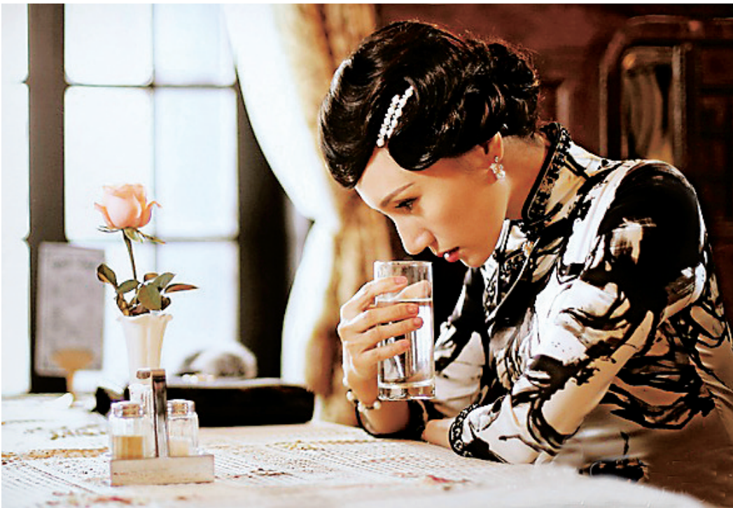
爱恨纠葛的男女情感是谍战剧的特色,《锋刃》也是如此

2005年《暗算》问世,导演柳云龙声名鹊起,从此谍战的魅惑深植人心;2009年《潜伏》热播,孙红雷大智若愚的做派成为现代职场的必胜宝典,而剧中余则成和翠萍的真假爱情成为亿万观众茶余饭后的笑料和谈资;其间又有《黎明之前》《悬崖》《断刺》等佳作倍受瞩目。在谍战剧发展成成熟层次丰收,观众深知其味的情景下,2015年横空出世的《锋刃》面临巨大的挑战。