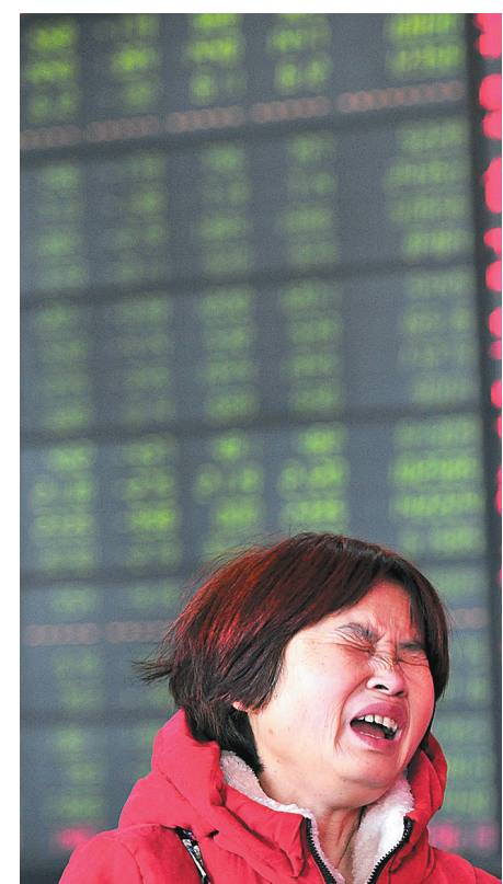
1月19日,一名股民在安徽省合肥市一家证券营业厅内关注股市行情。