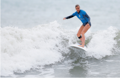
在万宁日月湾，选手在比赛中。

客栈”的一家酒店，有130多间客房。酒店管理负责人朱燕说，这家酒店早几年前就存在，在看中日月湾的发展势头后，于去年6月进行了重新装修，11月开始营业。装修前酒店的日均入住率只有20%到30%，现在得益于冲浪赛事的频繁和日月湾名声的壮大，已经上升到40%至50%，赛事举办期间几乎达到100%。“以前入住的主要是团客，现在更多的是散客，住宿时间也更长。这说明日月湾的旅游正在向休闲类型转变。”