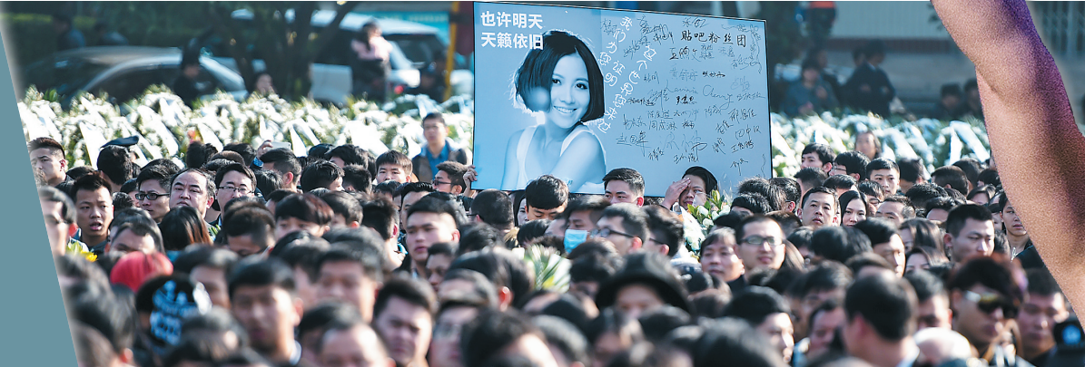
数千歌迷来到现场,送姚贝娜最后一程。