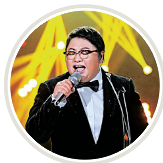
韩红在《我是歌手》第三季舞台上

不鸣则已,一鸣惊人。誓要大展身手的韩红重装上阵,继吉他乐手、管弦乐队、陶笛大师之后,她又花重金请来了内蒙古大学艺术学院马头琴乐团倾情助阵,12位乐手的豪华阵容一字排开,顿时将整个舞台变成了一个极具艺