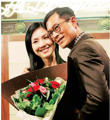
电影《可爱的你》剧照

记者了解到,由香港银都机构、寰宇娱乐和北京剧魔影业等联合出品的《可爱的你》,讲述的是因元田幼儿园的5个孩子缺少温暖,杨千嬅饰演的吕慧红和古天乐饰演的丈夫谢永东,决定放弃结婚10年之际周游世界的计划,吕慧红在丈夫陪伴和支持下,去帮助5个孩子并且最终使他们坚定了理想,收获了幸福。这部影片既有完美的爱情故事,更有夫妻情感之外的人间大爱的叙述,浓情蜜意之中,人间真情突显,丰富多元的情感讯息,淋漓尽致地呈现在观众面前。