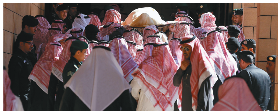
1月23日,人们在葬礼上抬着已故国王阿卜杜拉的遗体。