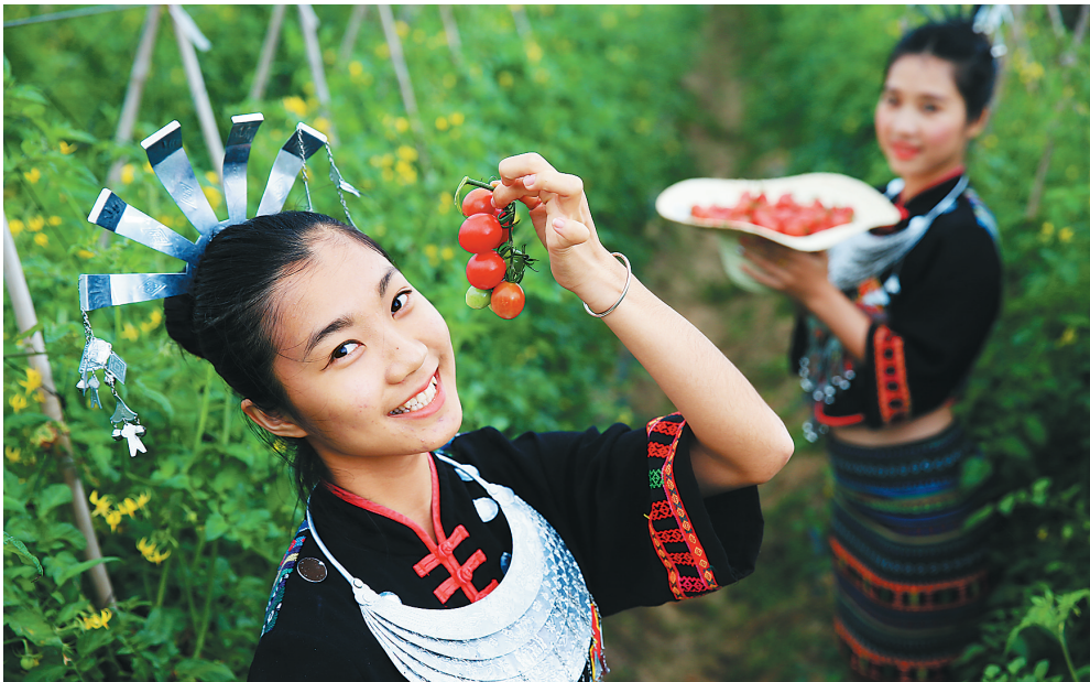
2015年陵水(光坡)圣女果采摘季暨乡村游活动启动。

据悉,未来几年,陵水除了继续推动农业与旅游业的结合外,还将尝试推进体育赛事与旅游业相结合等多种结合方式,促进旅游与体育赛事、文化等产业融合发展,推动陵水经济又好又快发展。