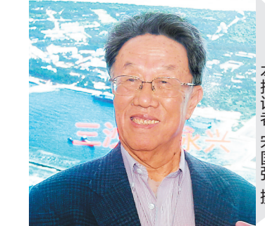
王蒙近照

是什么,让中国文坛重量级作家对三沙有如此的深情?本报记者近日对王蒙进行了书面采访,他畅谈了自己与三沙30多年来的感情渊源,并动情地说,“南海、三沙让我感动得落泪。”