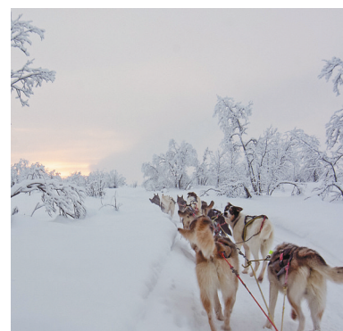
阿拉斯加雪橇犬。