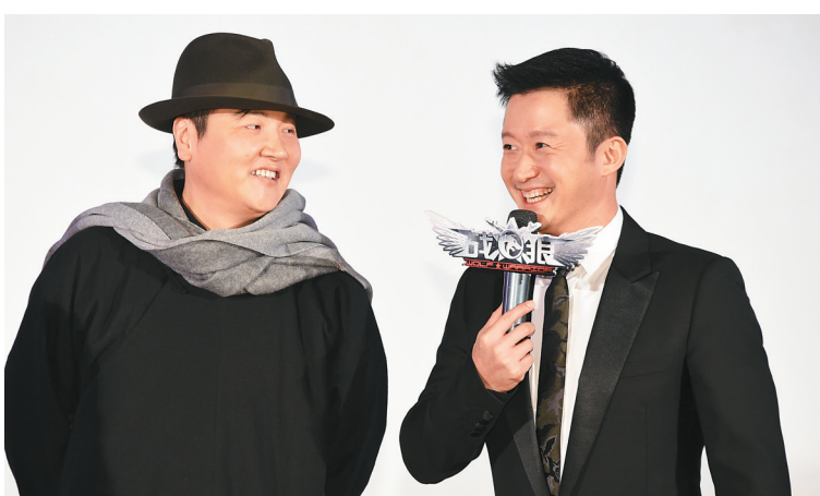
孙楠(左)吴京在《战狼》发布会现场

从观众熟悉的“功夫小子”,到如今成熟有担当的丈夫和父亲,吴京一路走来经历过无数困难,但也收获了很多,尤其是执导《战狼》,使吴京从“功夫小