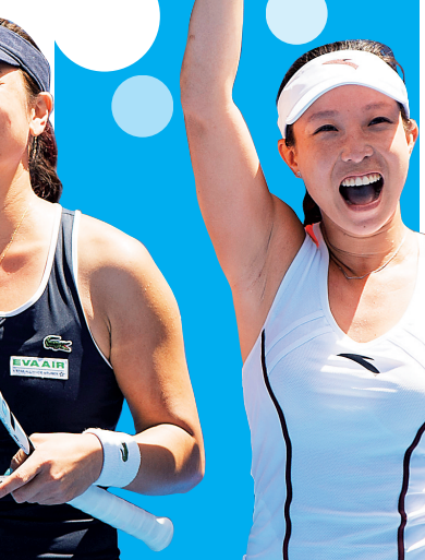
郑洁(右)和詹咏然庆祝胜利。