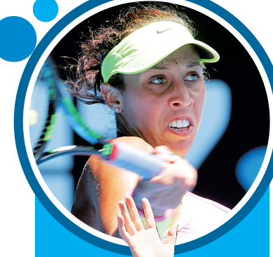
美国小将凯斯成为本届澳网最大黑马。

另一场男单1/4决赛,卫冕冠军瓦林卡以凌厉的攻势3:0(6:3、6:4、7:6)横扫锦织圭晋级,半决赛将战德约科维奇。