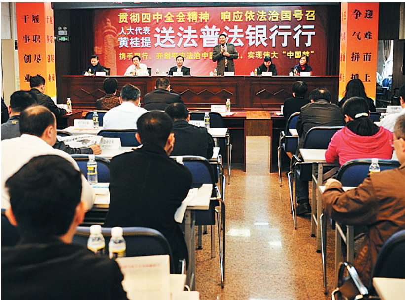
中国农业银行海南省分行举行普法送法活动。

他认为:“今天的中国是发展中国家,金融业的发展水平与世界发达国家还有一定的差距,我们的金融业特别是银行业,更要创新、更需加强法治建设,现代社会需要更多文明守法、有创新精神、有理想和追求的银行家,新农村的建设需要农业银行的更多扶持”。