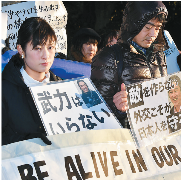
2月1日,日本民众走上东京新宿街头,手举标语批评安倍政权将国民生命安全置于危险之中。