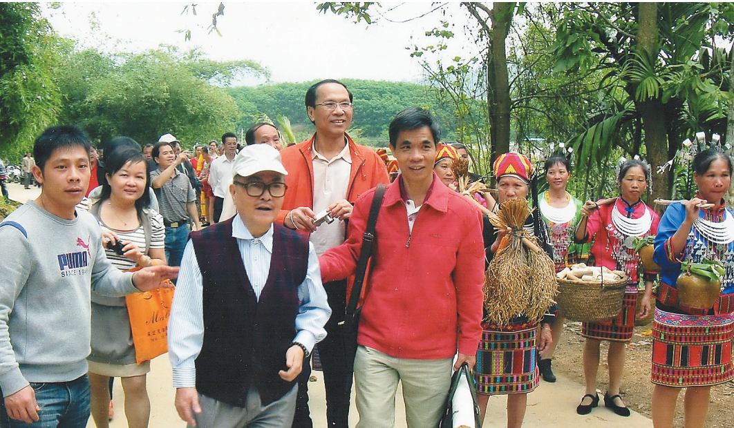
海南诗社诗人在黎寨采风。

晨雾刚刚散去不久，他们便从四面八方相约而来。不一会儿，清汤粉、明火粥、菠萝包……海南人熟悉的早茶餐点就琳琅满目地摆了一桌，好不热闹。食物的热气氤氲着，悠悠地升腾在他们之间，被笑语欢言驱得来回飘荡。