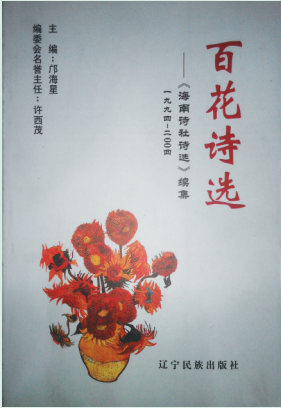
海南诗社作品集《百花诗选》。