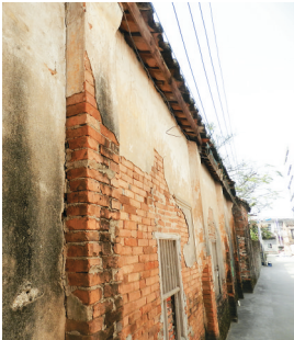
万安书院东侧横廊斑驳的墙体。