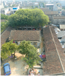
俯瞰万安书院遗址。

清乾隆二十八年举人出身的万城后朗村人杨景山赴京考中进士,任江西崇义知县。其侄杨士鼎赴省城参加乡试也考中举人,被州民誉为“雁塔叔题名,黄卷钦定膺二甲;龙门侄高跃,红旗教习有三年。”杨景山20岁中举人,42岁中进士,其子6人,孙10人,曾孙3人,分别考中庠生、廪生,岁贡生、恩贡生、府贡生,博得“世代书香”称誉。 道光十七年北坡南福村贡生参加乡试考取第二十四名举人。功成名就者,举不胜举。科举年代书院为官办的万州最高学府,学子为脱掉布衣换紫袍,追求功名,学而优则仕;而寒窗苦读不辍于书院,是当年参加科举考试的学子获得知识和智慧的庄严圣堂。