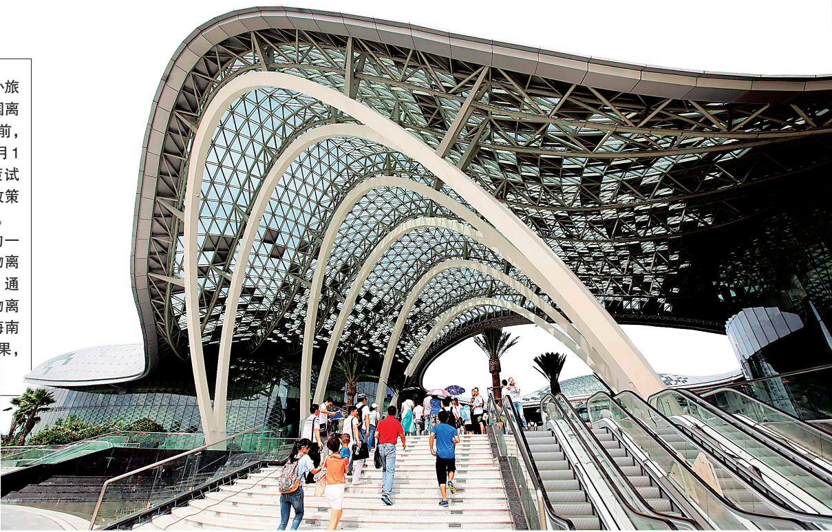
海棠湾免税购物中心。

近日,财政部正式发布《关于实施境外旅客购物离境退税政策的公告》,标志着我国离境退税政策正式在全国范围内启动。此前,为探索建立离境退税制度,自2011年1月1日起,我国便在海南开展离境退税政策试点。此次印发的公告,就是在海南试点政策的基础上,进行适当调整和完善后出台的。 在国家支持海南国际旅游岛建设的一系列政策中,购物政策包括境外旅客购物离境退税政策和离岛旅客免税购物政策。通过近几年的积极实践,借助境外旅客购物离境退税政策和离岛旅客免税购物政策,海南在推动旅游购物等方面取得了丰硕的成果,同时也积累了不少发展经验。