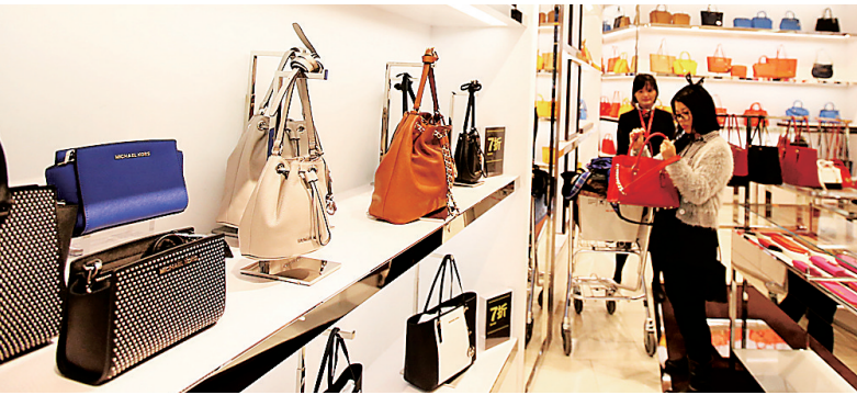
旅客在美兰机场离岛免税店选购商品。