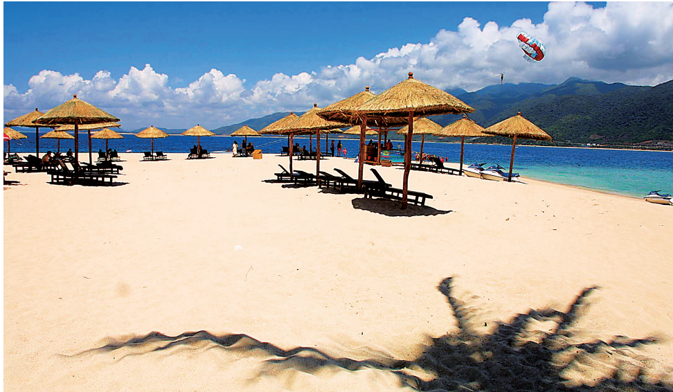
优渥的滨海风光为我省吸引了许多游客。