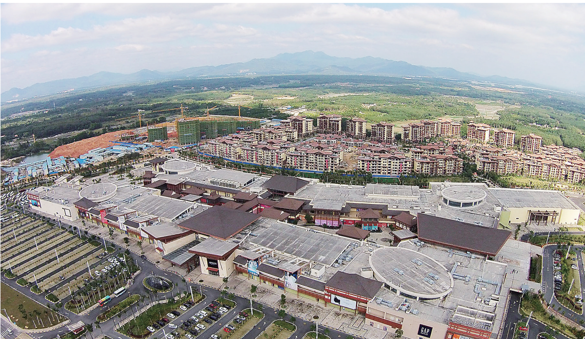
万宁首创奥特莱斯项目全景。此项目以国际知名大牌折扣店为发展核心,吸引了不少游客。

一些业内人士提出,与其他一些主要旅游地区相比,海南服务业比重仍偏低。例如香港、澳门的服务业比重达到90%左右,北京等地服务业也达到70%以上。同时海南餐饮、交通、住宿等传统服务业占比比较高,而金融、保险、文化、健康等现代服务业占比不够高。 “‘十三五’期间,海南需要通过扩大服务业开放,来加快推进服务业转型升