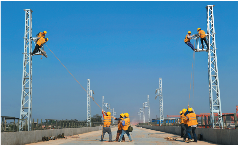
西环首列调试动车预计9月上线

分发挥党员干部带头作用全面深化殡葬改革的实施意见》,促进形成党员干部带头、群众参与、社会共同推动殡葬改革的良好局面。加大殡葬服务设施建设力度,完成西部(儋州)殡仪中心主体工程建设,做好东部(万宁)殡仪中心建设前期准备工作;推进公益性公墓建设,抓好中部地区生态公墓建设,推广生态节地殡葬。继续治理“三沿七区”乱埋乱葬,有效遏制新的乱埋乱葬。按照新型城镇化发展要求,编制省级殡葬事业发展规划,推动殡葬改革有序健康发展。加大殡葬改革宣传工作力度,充分发挥党员干部的带头作用,教育和引导群众移风易俗、实行文明生态节地殡葬。