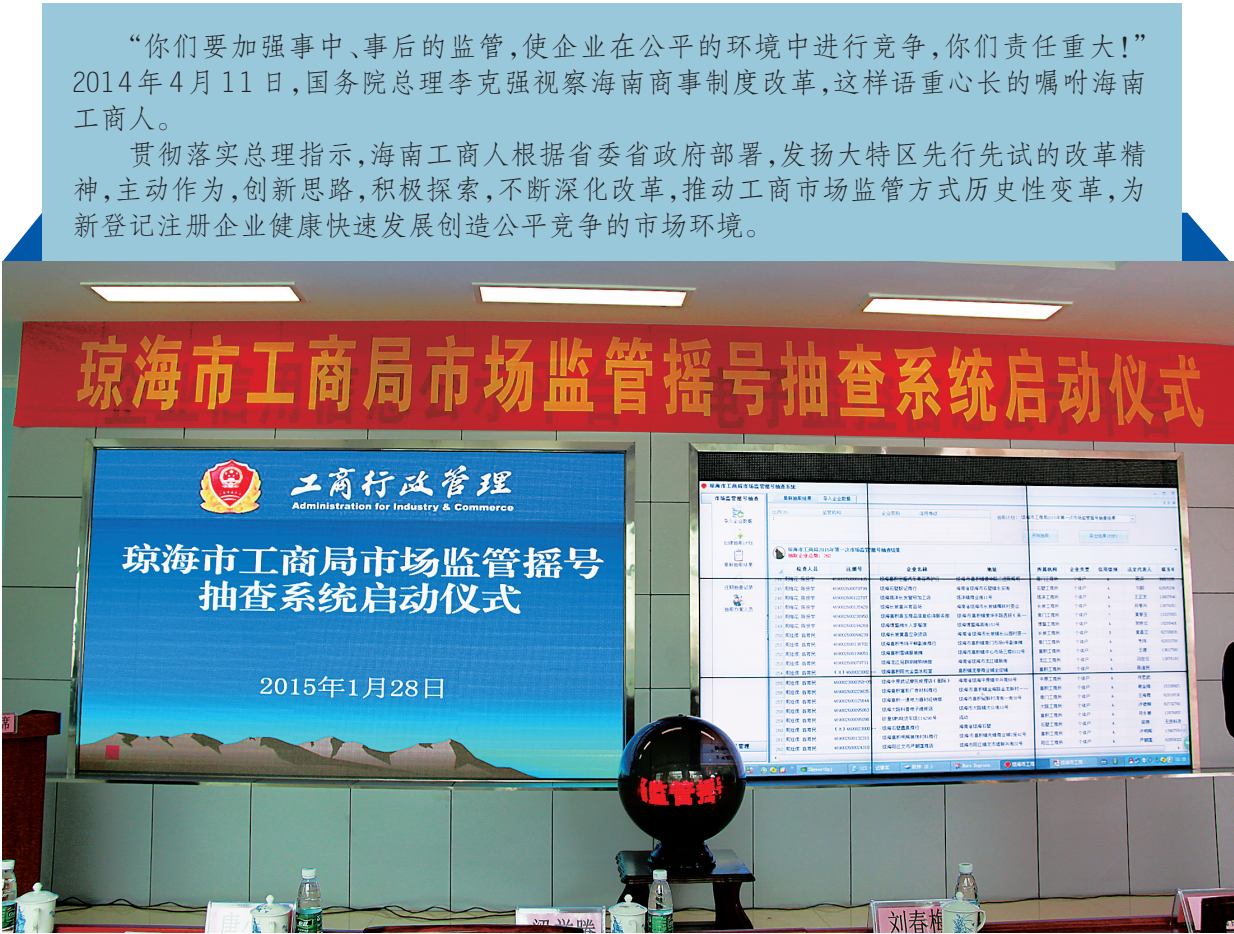
海南工商市场监管,创新理念、机制与方式,被检查对象与执法人员全部电脑摇号产生,并进行随机配对,结束“人盯人”、“坐堂式”、“运动式”传统执法历史,市场监管走向公开、公平、公正。图为琼海工商首次举行市场监管摇号抽取市场主体的现场。

率先建立“企业信用信息公示平台” 海南工商企业信用信息公示系统 去年3月5日正式上线运行,向社会公 示全省各类市场主体登记信息、备案 信息、行政处罚信息等内容。自系统对 外发布以来,日均访问量超过1万次。目