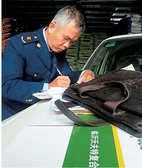
海口工商局查处假肥料执法现场。

编后: 树立信息化思维和大数据理念,运用好信息、网络、大数据技术和资源,是工商和市场监管部门履行好职责、创新监管方式的重要途径。海南省工商局从探索科技监管海鲜排档起步,到推进农资市场监管信息化建设并在全省农资经营店逐步推行电子台账,再到企业信用信息公示平台、电子行政监察系统、舆情监控系统等信息化平台不断建成,推进运用大数据加强市场监管的成效日益显露,全系统执法队伍的能力和素质也稳步提升。面对新形势新任务,创新监管理念,依托信息公示强化信用监管,不断提升信息化应用能力,是探索建立新型市场监管机制的内在要求,海南省工商部门的做法值得借鉴。