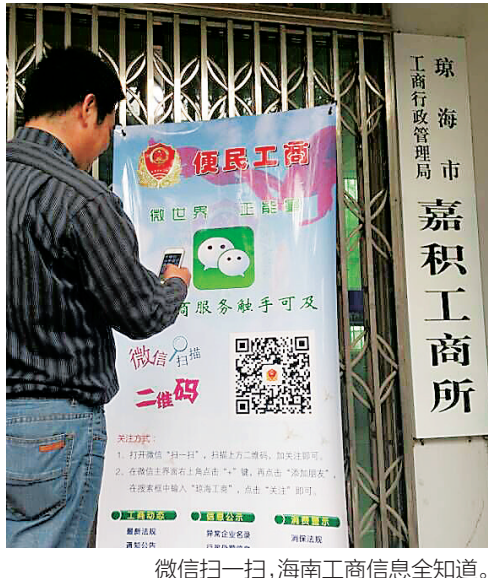
微信扫一扫,海南工商信息全知道。