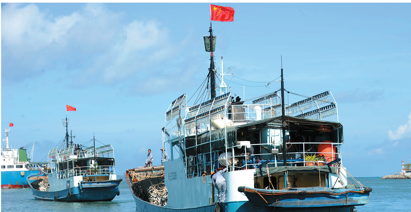
捕捞船队的渔船从三亚渔港出发，前往三沙传统渔场。

围绕国际旅游岛建设、经济特区建设、海洋强省决定和海南在“一带一路”建设中的战略定位，当前，深耕南海、大力发展海洋经济，寄托着人们的深深期盼。 “在近年来实现加快发展的基础上，未来我省将积极调整海洋产业布局，坚持传统和新型海洋经济协调发展，逐步形成门类齐全、结构合理、布局科学的新型海洋产业体系，全面提升海洋资源开发能力和海洋管控能力。”省海洋与渔业厅有关负责人今天表示。