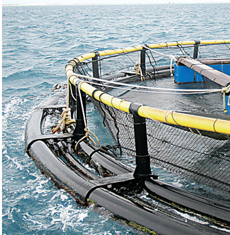
网箱养殖

“项目建设后，可充分发挥港北的渔业资源优势，做大做强海洋渔业，提高渔业的综合效益，培育和发展海洋产业体系。”吴云峰说。