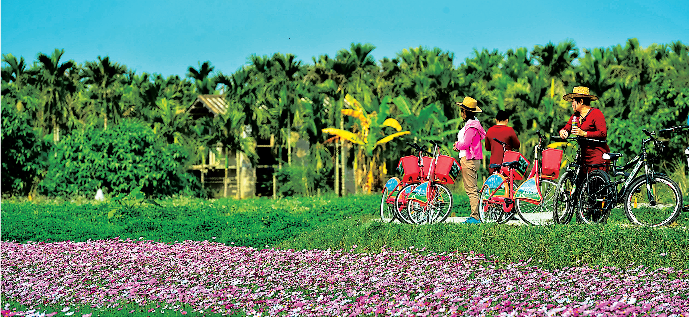
到处绽放的鲜花将琼海的新春打扮得艳丽多姿。