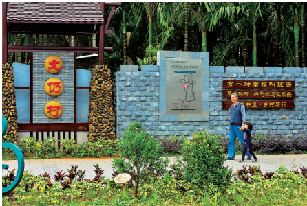
在美丽乡村中悠闲慢行。