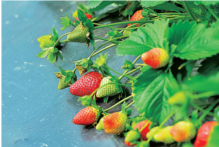
草莓满枝，等你来摘。