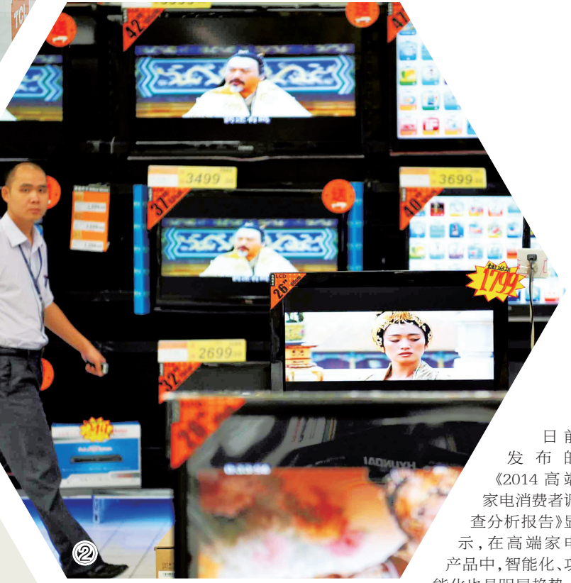
①卖场里的4K彩色电视机。②海口家电卖场。