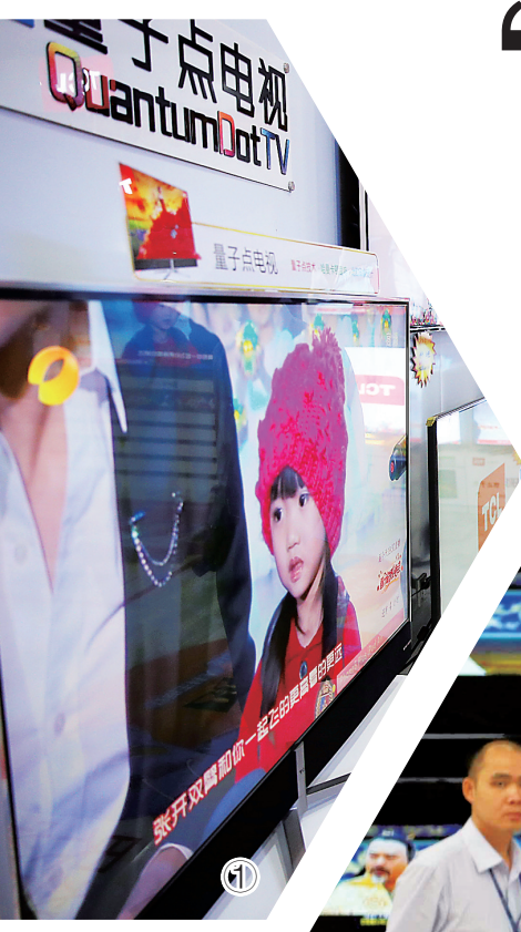
■ 本报记者 张靖超

2014年,高端家电在海南家电市场的表现令众多家电企业所瞩目。记者近日从国美电器了解到,去年高端家电在琼家电市场份额占到约20%,比2013年翻了一倍有余。 家电行业增速回调的大形势下,消费升级衍生出来的高端家电消费需求正成为家电行业最大的红利。