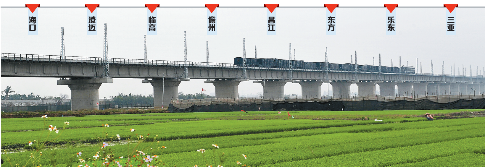
2月11日,新建海南西环铁路东方段铺轨工作正在紧张进行中。