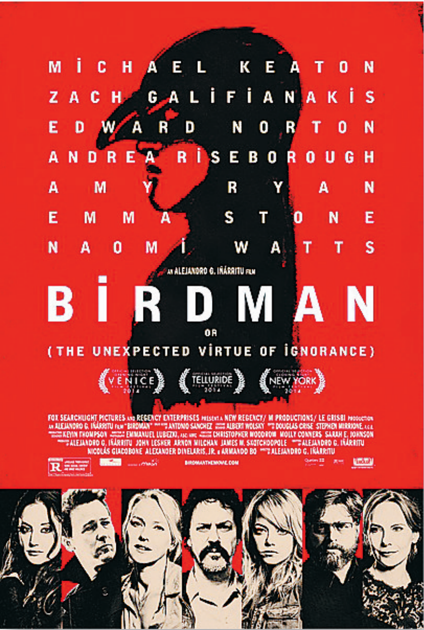
第87届奥斯卡最佳影片夺冠热门《鸟人》

同样来自威尼斯的《模仿游戏》(The Imitation Game),根据安德鲁·霍奇斯的传记《艾伦·图灵》改编,讲述英国数学家、逻辑学家图灵二战中协助同盟国破解德国密码系统的故事,影片有英国小生本尼迪克特·康伯巴奇加盟,用“神探夏洛克”的外壳去饰演同样