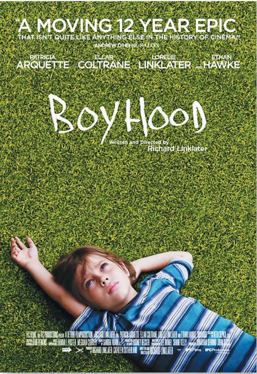
第87届奥斯卡最佳影片夺冠热门《少年时代》

最佳影片:《鸟人》 最佳导演:理查德·林克莱特《少年时代》 最佳男主角:埃迪·雷德梅恩《万物理论》 最佳女主角:朱丽安·摩尔《依然爱丽丝》 最佳男配角:J·K·西蒙斯《爆裂鼓手》 最佳女配角:帕特里夏·阿奎特《少年时代》 最佳原创剧本:韦斯·安德森《布达佩斯大饭店》 最佳改编剧本:达米安·沙泽勒《爆裂鼓手》