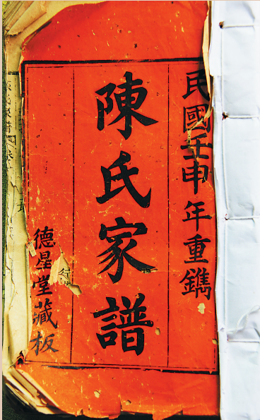
民国壬申年（1932 年）续修的 15 卷本《陈氏家谱》，目前完整的仅发现一部。