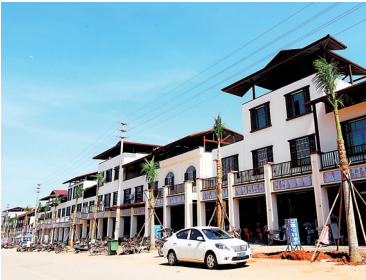
定安龙湖文化风情小镇。