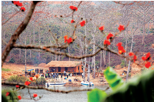
昌江木棉花开。

同时，昌江还是目前海南楼市的价值洼地，资源优秀、独特而房价偏低，随着2015年海南西线高铁建成通车，以及整个棋子湾旅游度假区的开发完善，昌江必将迎来迅猛发展，到时候房地产价格也会得到大幅度提升。所以，现在在昌江买房是最好、最合适的时机。（符辑）