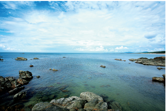
昌江棋子湾风光。