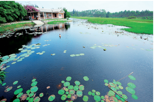
昌江海尾湿地公园。