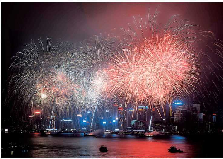
2月20日，璀璨的烟花在香港维多利亚港上空绽放。当日是农历大年初二，香港在维多利亚港举行农历新年烟花汇演。汇演历时23分钟，共分9幕，由3艘趸船发放23888枚烟花。

“你抢了多少红包？”长辈给晚辈红包的传统年俗，在微信时代演变成一场同事好友中的“抢红包”大战。“盯得眼花、戳的手疼”成为很多网友过节的生动写照。