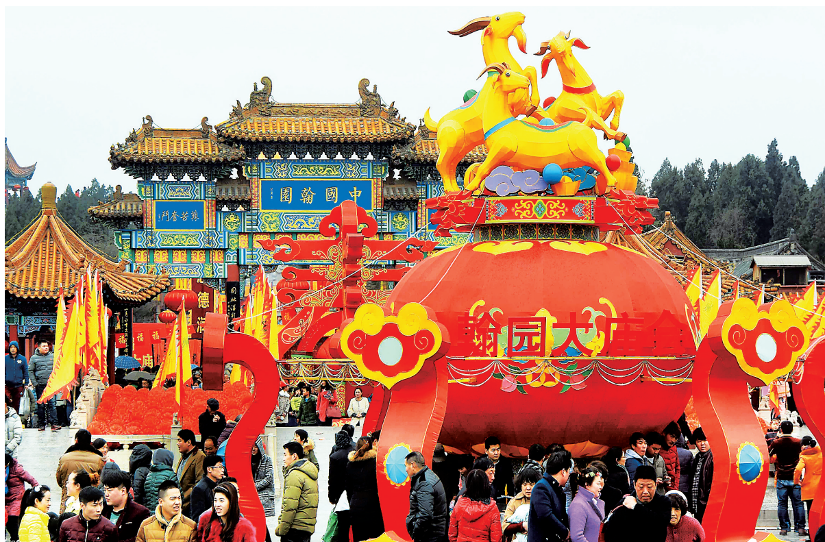
2月20日，游客在开封一个民俗庙会上参观。

如今，便捷的交通让千余公里的距离变得朝发夕至，就是天涯海角也不过一两日的行程。但沧海桑田、大千世界，无论怎样变迁，深藏人之血脉之中的乡土、乡情和乡愁情怀却亘古不变。