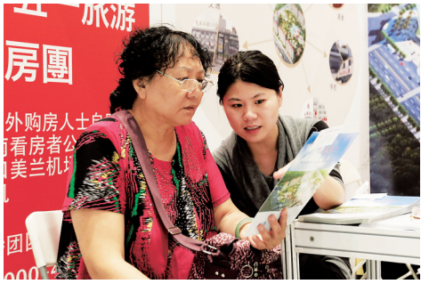
2月23日，2015海南（三亚）春季房地产交易博览会展馆内，销售人员在给客户介绍情况。