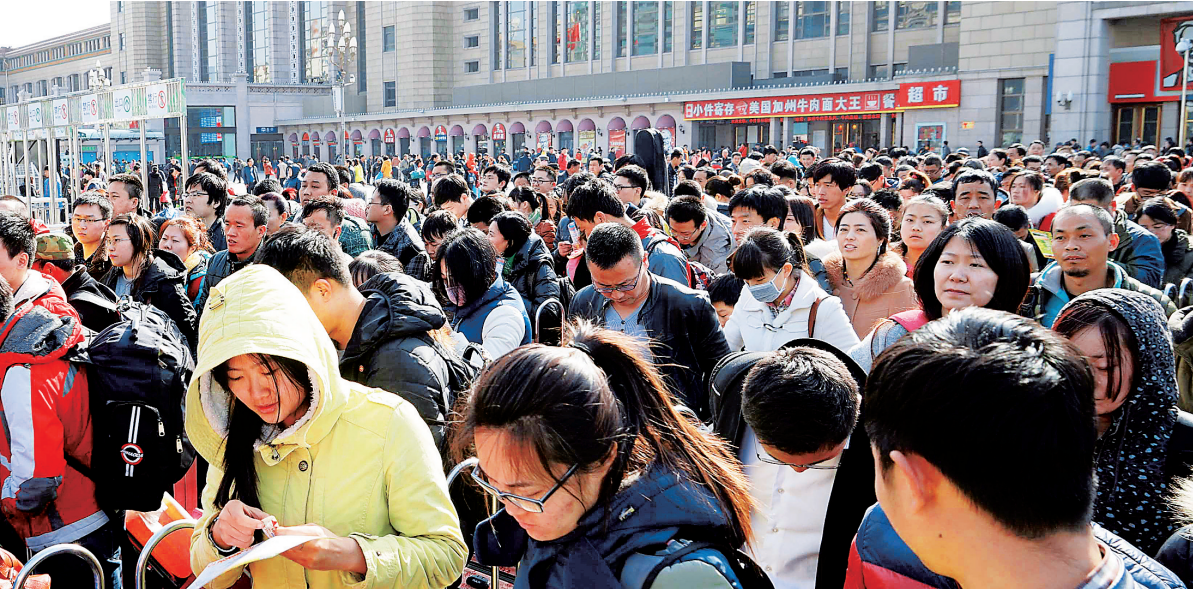
2月23日，旅客在北京站地铁口等待进站乘坐地铁。

铁路部门提示，23日是春节假期旅客返程客流高峰，已通过互联网成功购票但尚未取票的旅客，请尽量提前办理取票手续，并预留出足够的进站候车时间。