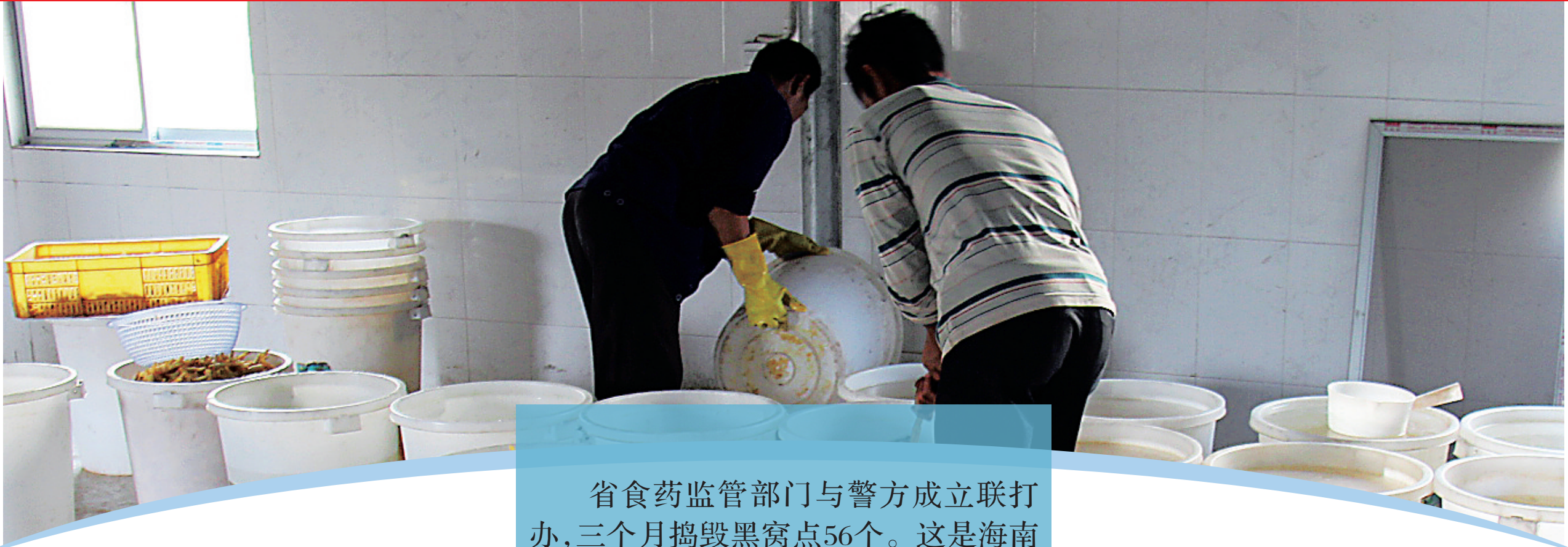
非法加工双氧水泡凤爪的黑窝点。