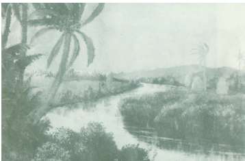
杨炎作品《海南风光》