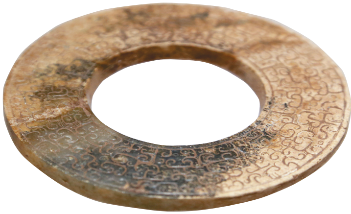
春秋和田玉蟠螭纹玉环

在有确切史书记载的夏、商、周之前,中华文明仅见于传说之中。但璀璨纷繁的玉器,为这段有记载以前的历史,作下了有力的注脚,同时也为自己披上了一层神秘的面纱。