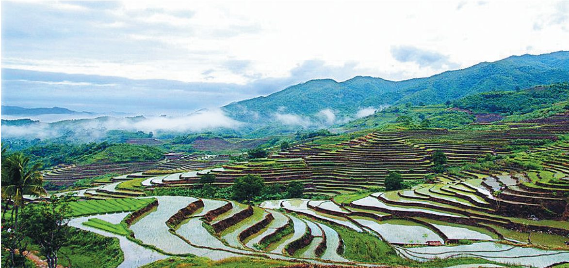
“微场景”展示的昌江牙胡梯田。

抓起，尤其是像海南这种沿海省份，这类教育应成为必修课程。” 针对旅游发展问题，微友“小桔子_ybyb”建议：“要强调通过立法，对各类旅游主体的利益调整，减少冲突和对立。海南要建国际旅游岛，这一块尤其要迈开大步，为其他地区的旅游发展积累经验。”谈到海南经验，微友“橘子嘴”说：“海南抓作风建设也是非常早的，在从严治党上也积累了一定经验。海南要发展，归根结底离不开人，尤其是一大批作风过硬、能力过硬、胆识过硬的党员干部。这方面，海南要更有责任感、使命感和紧迫感。不但要反显性腐败，也要反‘不干事不担事’的隐性腐败。”