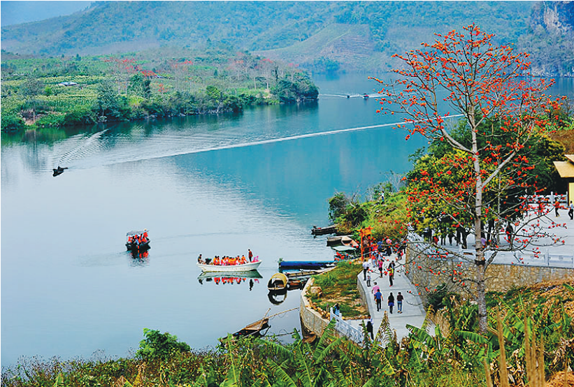
“微场景”展示的昌化江畔木棉红。