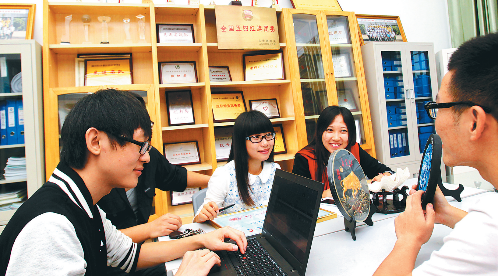
大学生创业者们在讨论产品的开发思路。