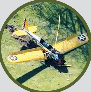
哈里森·福特的飞机

本报讯 哈里森·福特驾机坠毁后，他的儿子第一时间在社交媒体上发布消息称，父亲“正在医院接受治疗，受伤不轻但一切还好，他是一个坚强的男人”。