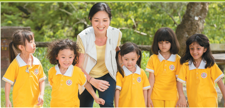
杨千嬅在《可爱的你》中与5个孩子情同一家人