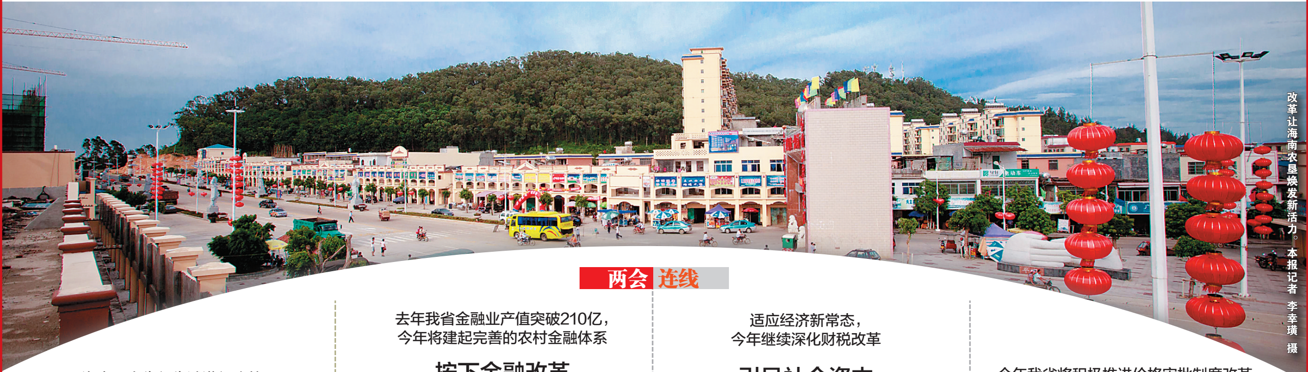
改革让海南农垦焕发新活力。