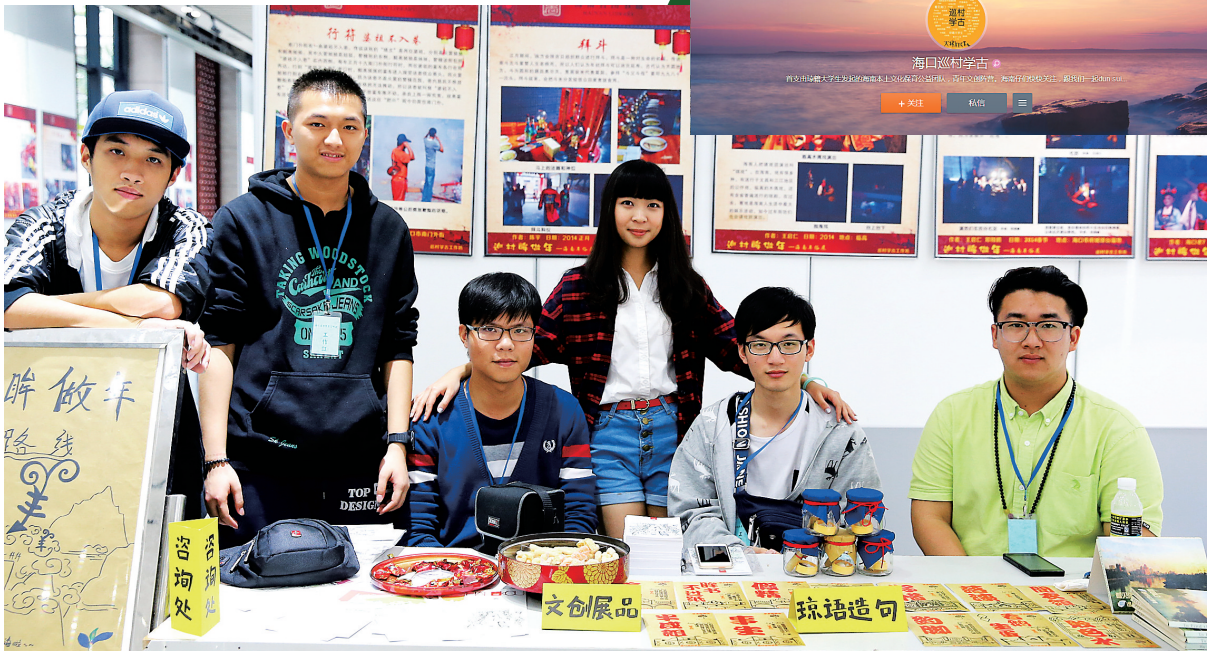
海口巡村学古工作坊的一群琼籍90后大学生，图为近日他们组织的首个海南年俗展在省图书馆展出。

此外，一些社会团体以及商家、政府部门和海南的一些市县也看中了“微平台”的传播力量，也注册微博、微信推广海南文化。如万宁就推出了万宁旅游、万宁发布厅两个微信公众平台，挖掘万宁鲜为人知的旅游资源和本土文化，引发了人们的关注。