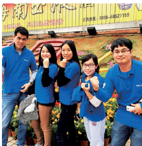
“海南心发现”年轻的团队。

政府部门和海南的一些市县也看中了“微平台”传播力量，注册微博、微信推广海南文化。如万宁就推出了万宁旅游、万宁发布厅两个微信公众平台，挖掘万宁鲜为人知的旅游资源和本土文化。