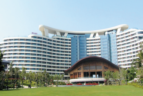
三亚海棠湾天房洲际度假酒店。