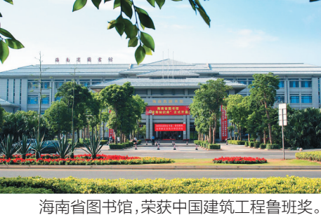
海南省图书馆，荣获中国建筑工程鲁班奖。