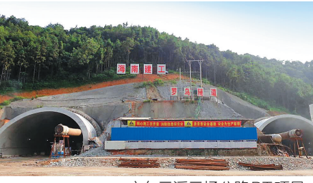
广东云浮云场公路BT项目。