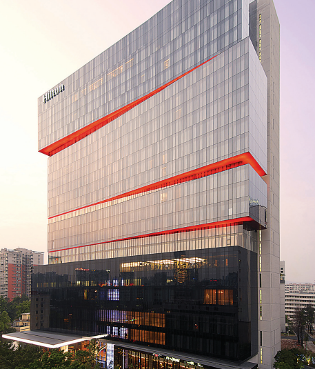
广州新天希尔顿酒店，荣获中国建筑工程鲁班奖。