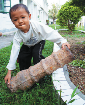
海南明代火銃。