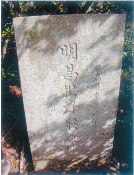
临高昌拱烽堠遗址。