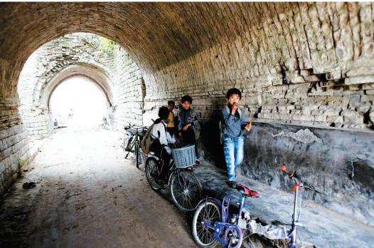
儋州中和明代古城遗迹。