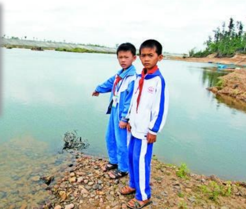
被救起的两名落水儿童讲述被救经过。