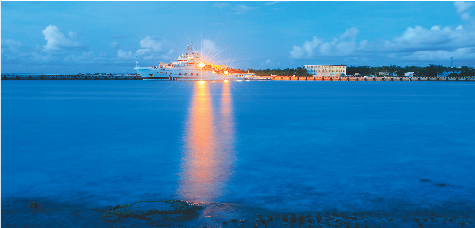
三沙永兴岛综合码头。

参加全国两会13年,历任十届、十一届、十二届全国人大代表,从事国家海洋战略研究的我省全国人大代表高之国动情地说,“13年来关注海洋,今年政府工作报告对海洋的表述是最系统完整和最有力度的一次!” 推进国家海洋强国战略的历史浪涛,澎湃着我省全国人大代表和政协委员们的心潮。 李克强总理在《政府工作报告》中指明:我国是海洋大国,要编制实施海洋战略规划,发展海洋经济,保护海洋生态环境,提高海洋科技水平,加强海洋综合管理,坚决维护国家海洋权益,妥善处理海上纠纷,积极拓展双边和多边海洋合作,向海洋强国的目标迈进。 向深蓝进发的号角吹响,代表委员们热议呼吁,正确审视并积极利用好南海现有资源,在大力发展海洋经济和调整海洋产业结构上狠下工夫,为海南海洋强省战略持续发力。