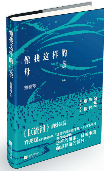
《像我这样的母亲》 江苏凤凰文艺出版社 2015年1月出版