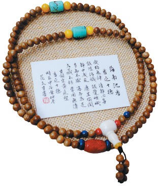
每条手串都是独一无二。