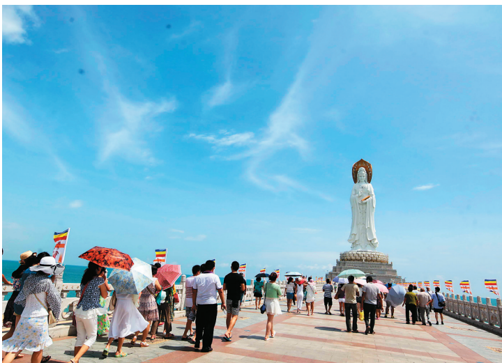
游客在三亚南山景区参观游览。