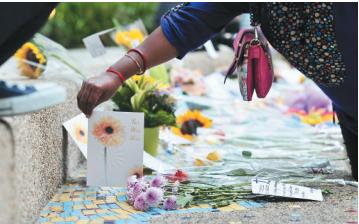
3月20日，市民在新加坡中央医院献花及祝福卡。 新华社发（邓智炜摄）

新加坡总理公署20日中午发布公告说，建国总理李光耀病情依然危重。深爱他的新加坡国民在为他祈福。他的病情牵动了全世界的目光。 今年2月5日，李光耀因感染严重肺炎入院接受治疗。28日，新加坡总理公署发布消息称李光耀病情稍有好转，但是仍然使用镇静剂、呼吸机及抗生素。本月17日，新加坡总理公署证实李光耀病情恶化。