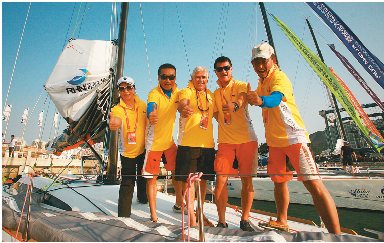
20日,环岛国际大帆船赛在三亚举行船队下水仪式。

成的本土赛队。此外,以麦博号、联创号为代表的多支优秀赛队再度参赛也为今年的比赛增添了更多的看点。比赛定于3月21-28日举行。 本届海帆赛由海南省人民政府主办、海南省文化广电出版体育厅、中国帆船帆板运动协会、海南海事局、交通运输部南海救助局、海口市人民政府、三亚市人民政府、万宁市人民政府、陵水黎族自治县人民政府承办,海南省体育赛事中心、阿罗哈、三亚半岛帆船港有限责任公司协办,海南环海南岛国际大帆船赛有限公司运营。