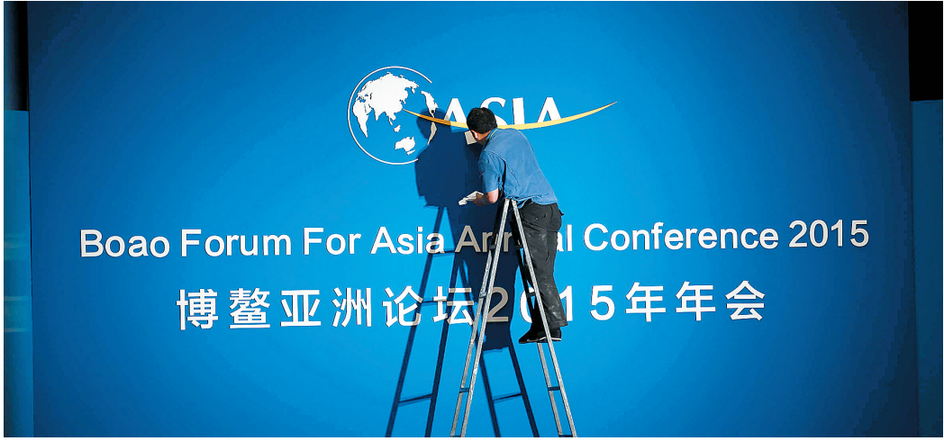
三月二十四日,在博鳌亚洲论坛年年会会场,工作人员正在布置背景墙。

南方航空还特别加大了对驾驶舱、客舱装饰板、侧壁灯壁板、地毯、地毯压条、书报袋等设施 and 应急设备的维护检