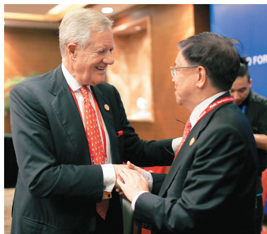
3月26日，在博鳌亚洲论坛2015年年会咨询委员会开始前，博鳌亚洲论坛国际咨询委员会委员龙永图与联合利华公司董事长泰斯库握手寒暄。