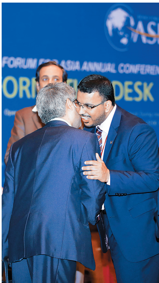
3月26日，博鳌亚洲论坛2015年年会即将开幕，抵达的嘉宾热情问候。