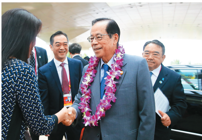
3月26日，日本前首相、博鳌亚洲论坛理事长福田康夫抵达博鳌亚洲论坛大酒店。