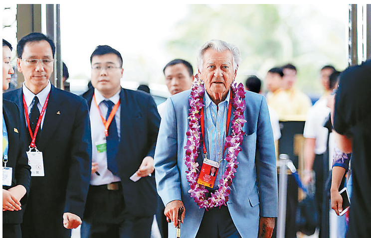
3月25日，澳大利亚前总理、博鳌亚洲论坛发起人之一的霍克先生抵达博鳌亚洲论坛大酒店，受到热烈欢迎。