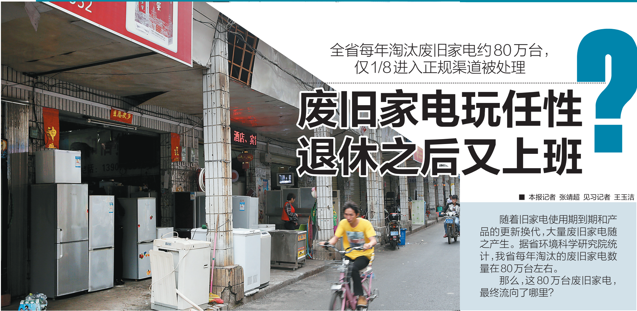
海口市大英路上经营回收家电的店铺。